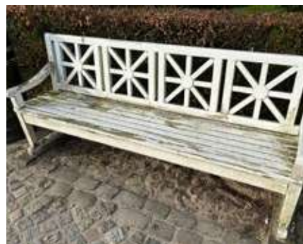
Eksempel på opgaven med vask af bænke.

Alle bænke på voldanlæg og i midtbyen vaskes af og renses. Undtaget herfra er bænke omkring pladsen ved Landsoldaten og Frederik d. 3. Plads. Det kan komme på tale at nytteindsatsen kan indebære at male bænkene, så de holder længere.