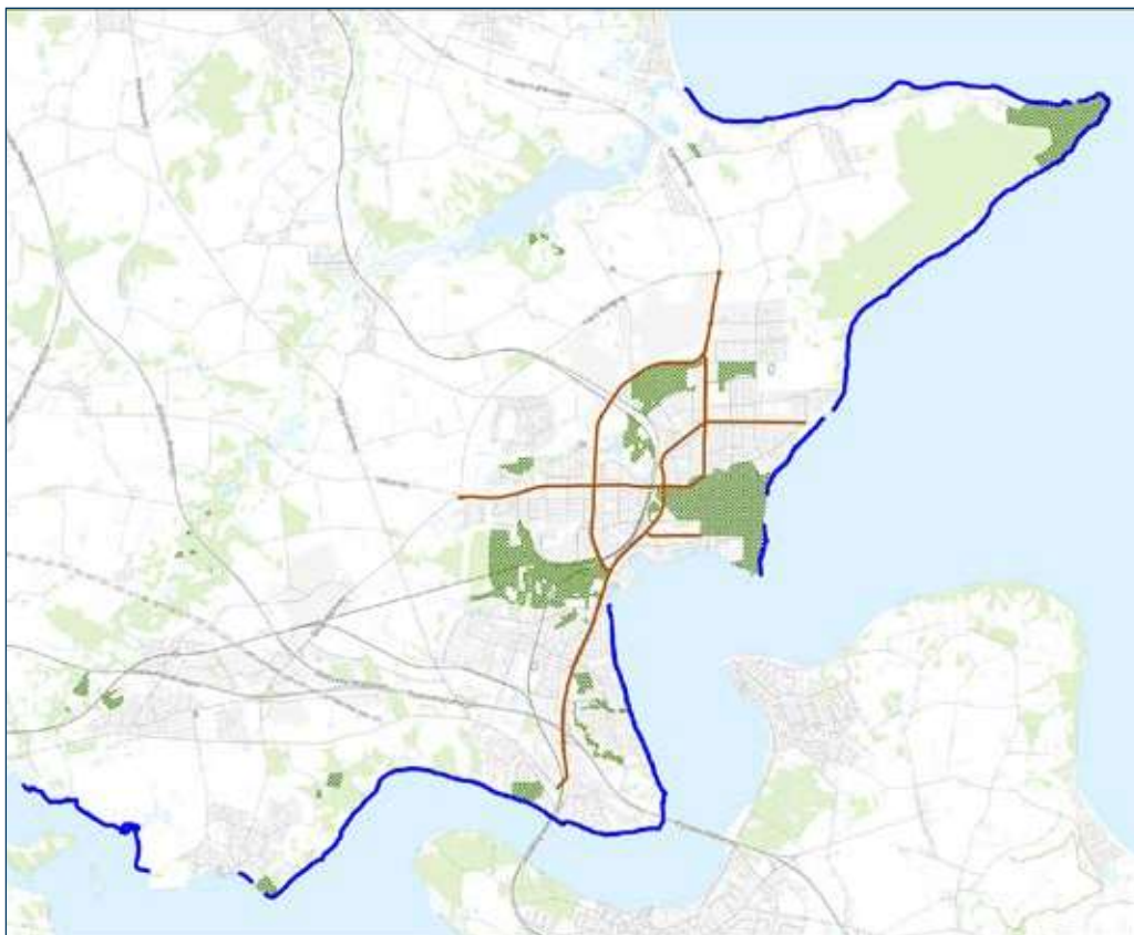
De relevante strandarealer er markeret med rødt (dog undtaget strandarealer markeret med Blå Flag)

Afhentning af større portioner af sække, affald mv. bestilles ved Drift & Service, der udfører dette på regning for nytteindsatsen.