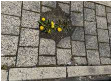
Eksempel på opgaven med at rense fortov.

Der renholdes for græs og ukrudt på steder, hvor der normalt ikke gøres noget eller hvor grundejere ikke overholder deres pligt. Der kan blive tale om, at der skal afleveres en folder i postkassen med slogan svarende til: "Fredericia har i dag hjulpet dig, næste gang hjælper du Fredericia".