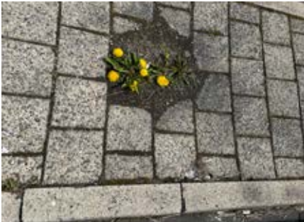
Eksempel på opgaven med at rense fortove.

Der renholdes for græs og ukrudt på steder, hvor der normalt ikke gøres noget eller hvor grundejere ikke overholder deres pligt. Der kan blive tale om, at der skal afleveres en folder i postkassen med slogan svarende til: "Fredericia har i dag hjulpet dig, næste gang hjælper du Fredericia".