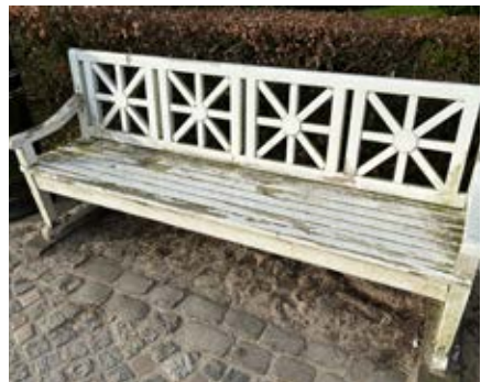
Eksempel på opgaven med vask af bænke.

Alle bænke på voldanlæg og i midtbyen vaskes af og renses. Undtaget herfra er bænke omkring pladsen ved Landsoldaten og Frederik d. 3. Plads. Det kan komme på tale at nytteindsatsen kan indebære at male bænkene, så de holder længere.